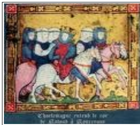
Charlemagne entendant le son de l'olifant

L'olifant: En entendant ce son Charlemagne s'est douté qu'il était arrivé un malheur à son neveu. Il accourut mais fut retenu par Ganelon qu'il lui dit que c'était sûrement une erreur. Au deuxième son de l'olifant il n'écoula pas Ganelon et vint au secours de son neveu, mais il était trop tard. Roland était mort. Alors Charlemagne le cœur brisé se vengea avec son armée en massacrant les Basques et en remportant la victoire.