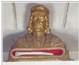
L'olifant de Roncevaux