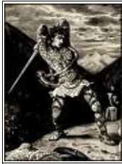
Roland essayant de briser Durandal

Mélanie: Comment Charlemagne a-t-il réagi?